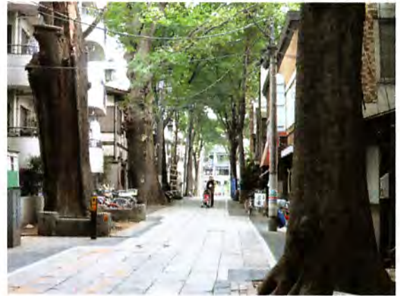
鬼子母神参道(豊島区)のケヤキ並木