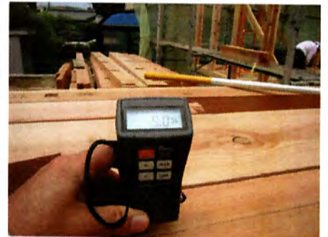
梁材の含水率測定