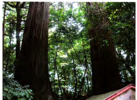
麻賀多神社(成田)の杉

この夏はこれまで体験したことのない猛暑になりました。一番暑かったのがお盆休みだったために私たち工事に携わるものにとって、いくらか救われた気持ちでした。皆様は健康でお過ごしでしょうか？