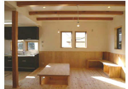
居間・テーブルは堀コタツ式です