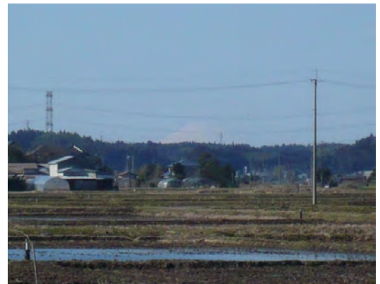
2月1日昼頃我が家近所から見た富士山