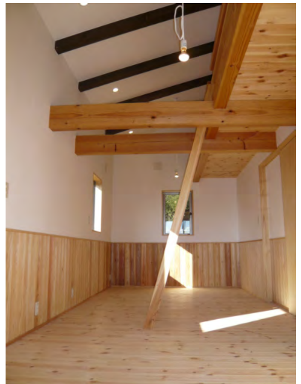
子供室は広く、天井を勾配にして高くとっています。

TACO家は東側に田園が広がりバルコニーからの眺めは格別です。床は松、壁には杉を張り込みました。壁には漆喰素材のペーストを塗りました。