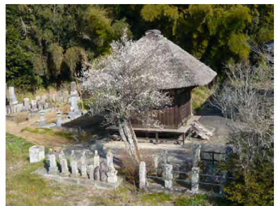
ある現場にて、梅咲くお寺の風情