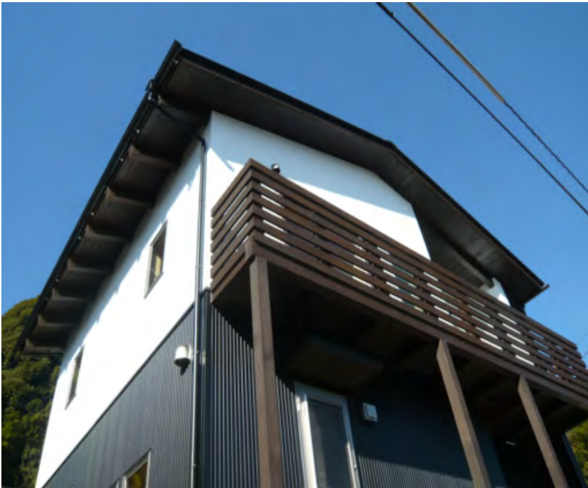
外観は白(漆喰)と黒のコントラスト